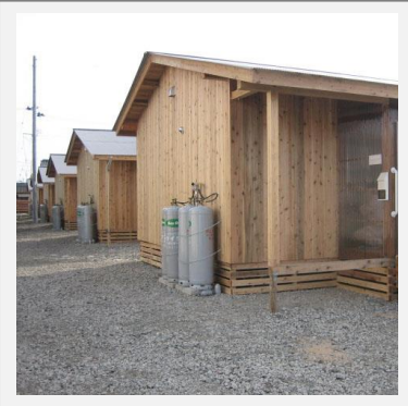
ポップエフ 21 体制