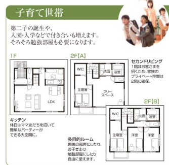
ライフスタイルの変化に対応した進化型住宅