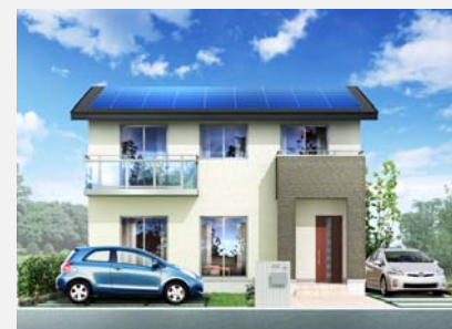
2階建ての家イメージ