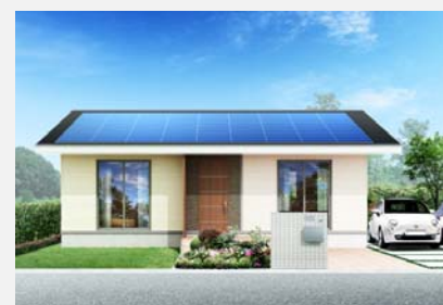
小屋裏利用の家イメージ

豊かな自然景観にも都会的な住宅街にも溶け込めるよう、落ち着いた色合いのシンプルなデザインとします。外観は太陽光発電の設置に配慮し、シンプルな切妻屋根とし、夏季の日射を考慮し軒を深くしています。