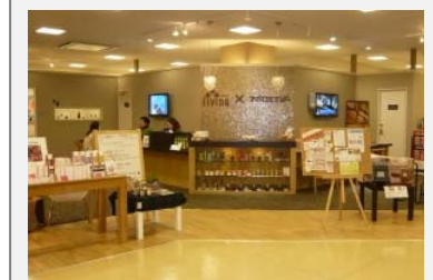
MAX ふくしま 3階相談窓口 (ほっとリビング)

一つの窓口でワンストップサービスが可能な団体を目指しています。また、MAXふくしまの3階にある(株)アポロガスほっとリビングのショールーム営業時間内はいつでもご相談を受け付けることが可能で、団体の受付窓口も兼ねています。特定分野の専門家のご紹介が必要であれば、当グループの連携を活かし、改めてご紹介とお打ち合わせの設定を行います。また、郡山市大町にも相談窓口を設置する予定です。