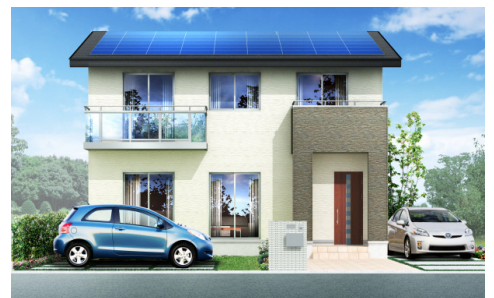
2階建ての家イメージ