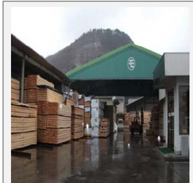
福島維新「福幸の家造り」匠集団 相談から受発注流通施工体制